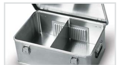
2 Trennwandführungen, 300 x 150 mm Bestell-Nr. 579310 € 11,-

* auf Europalette (1200 x 800 mm) abgestimmte Maße