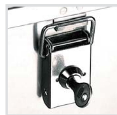
1 Paar Zylinderschlösser Bestell-Nr. 579330 € 13,-

Fahrgestelle aus Aluminium, 150 mm oder 440 mm hoch, siehe auch Seite 233